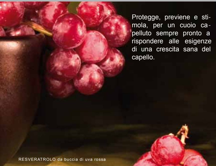
RESVERATROLO da buccia di uva rossa

Protegge, previene e stimola, per un cuoio capelluto sempre pronto a rispondere alle esigenze di una crescita sana del capello.