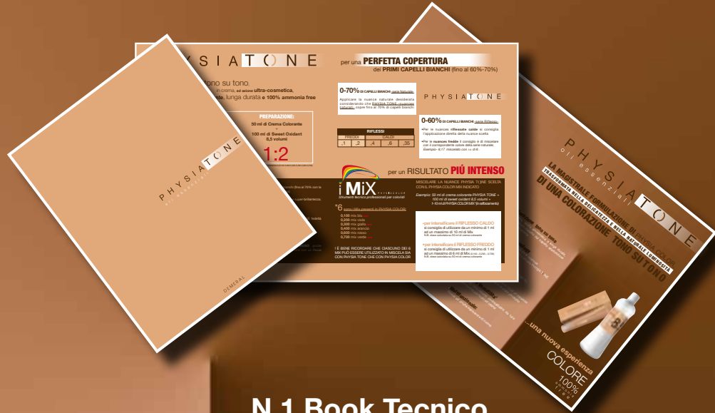
N.1 Book Tecnico